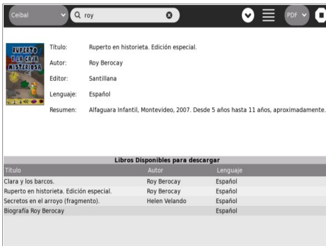
Figura 5. Ejemplo de descarga.

1. Iniciar la Actividad efectuando un clic sobre su ícono en la Vista Hogar.