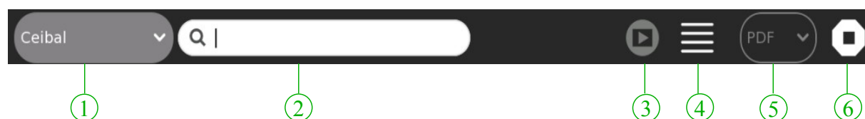
Figura 2. Barra de herramientas.

Desde la misma podemos establecer criterios para realizar la búsqueda de los libros y las preferencias de descarga. La Barra de herramientas muestra los siguientes elementos: