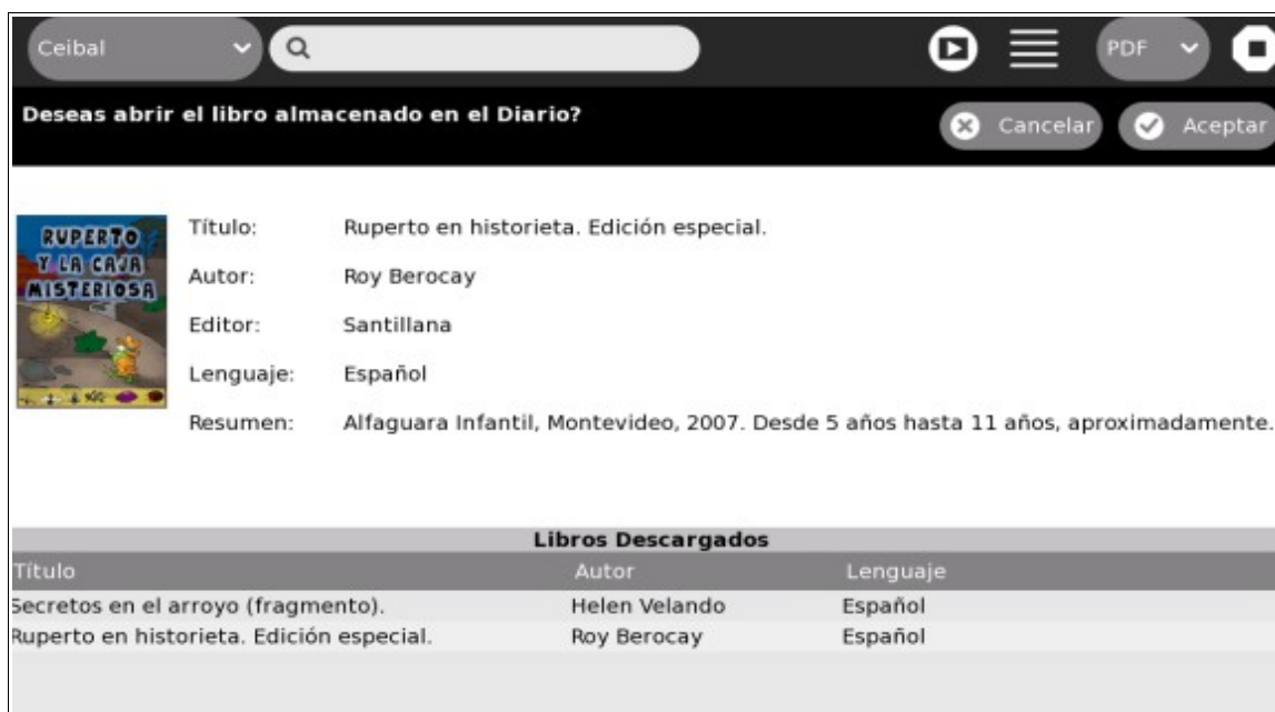
Figura 8. Confirmar abrir libro

Si presionamos el botón Aceptar , se abre el Diario en la vista detallada del registro.