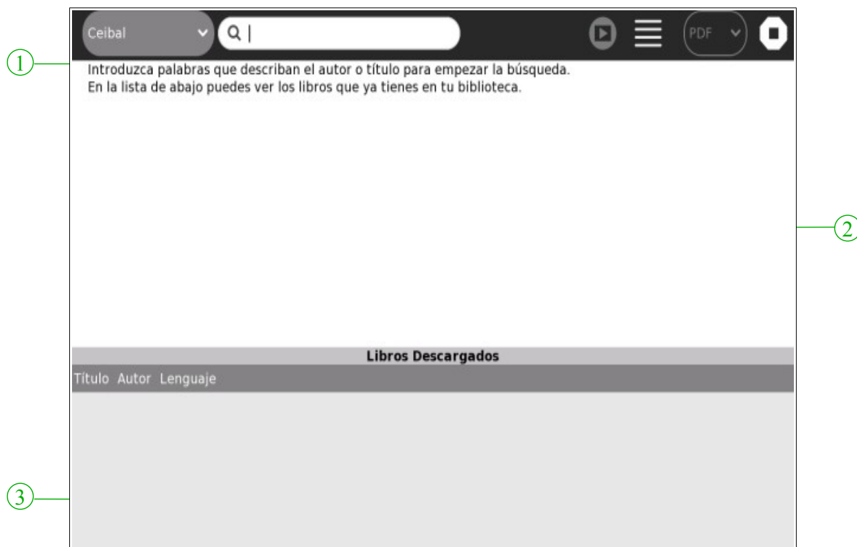
Figura 1. Pantalla de inicio

2.3 Libros Descargados. Muestra una lista con los libros disponibles para descarga, situada en la zona inferior.